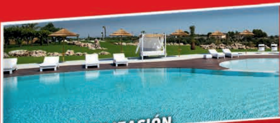
IMPERMEABILIZACIÓN DE PISCINAS