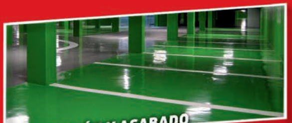
PROTECCIÓN Y ACABADO DE PAVIMENTOS