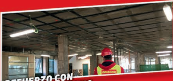
REFUERZO CON FIBRA DE CARBONO