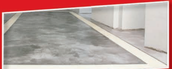
PAVIMENTOS CONTINUOS DECORATIVOS