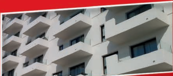
REPARACIÓN Y PROTECCIÓN DE FACHADAS